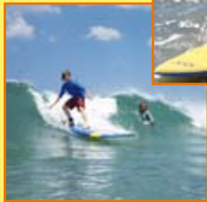
Ecole de Surf